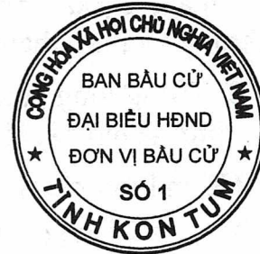
Hình số 3