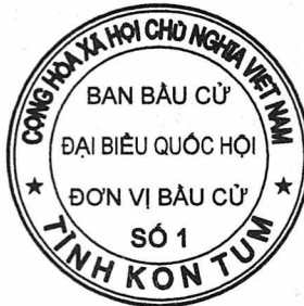
Hình số 2