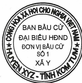
Hình số 7