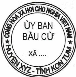
Hình số 6