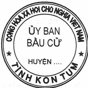
Hình số 4