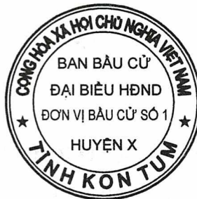
Hình số 5